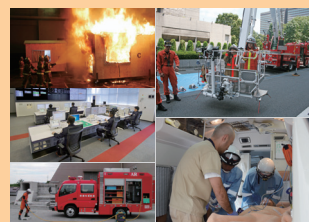
■ 表紙 本号掲載記事より

敬老の日に「火の用心」の贈り物 「住宅防火・防災キャンペーン」…………… 29 9月9日は救急の日…………… 30 事業所の消防団活動への理解・協力について…………… 31 第61回全国消防技術者会議の開催…………… 32